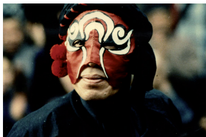
Le Roi des masques

La Nuit du chasseur de Charles Laughton, par Charles Tesson